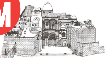
Рисунок русского паломника Василия Григоровича-Барского (XVIII в.)