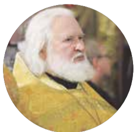
Протоиерей Владимир Воробьев, ректор Православного Свято-Тихоновского гуманитарного университета

– Хотел бы услышать следующее: «Я хочу получить духовное образование и подготовиться для служения Церкви и России».