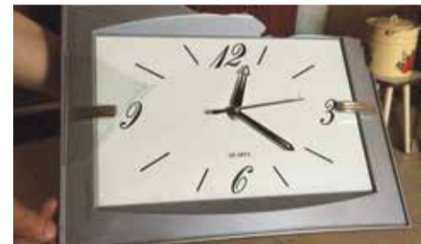
Часы из храма в честь иконы Божией Матери «Умиление» в Луганске, остановившиеся во время взрыва в ночь с 5 на 6 августа 2014 года в 00:21

Самое большое чудо – это то, что несколько тысяч человек до сих пор удерживают регулярную армию.