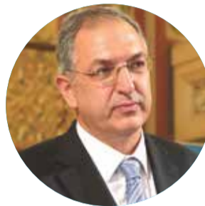
Константинос КАДИС, министр образования и культуры Кипрской Республики

Пользуясь случаем, хотел бы обратиться с приглашением к братскому русскому народу, с которым у нас общая вера: посетите нашу страну. Греция – сокровищница Православия. Монашеская республика Афон, Метеоры, Патмос. Нередко службы в храмах Греции проводятся на двух языках – русском и греческом, что еще раз подтверждает общность нашей веры и нашей культуры.